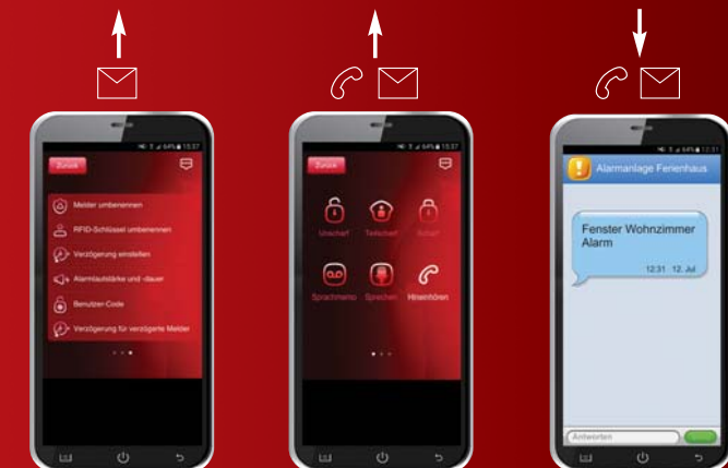
Einfache Einstellung, auch über App*-Oberfläche.