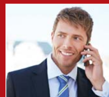
Hineinhören und Sprechen