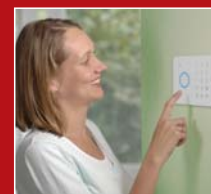
Ecouter les messages vocaux