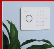
Fixer la centrale...

Pour pouvoir quitter votre habitation sans déclencher l'alarme.