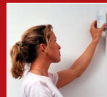
Monter les composants...