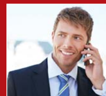
Ecouter et parler