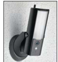
Lichtkamera zur Wandmontage im Außenbereich