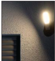
LED-Leuchte manuell, bei Bewegung oder nach Zeitplan schaltbar