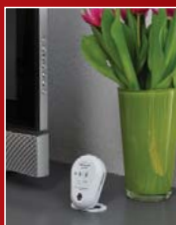
...oder zum Aufstellen