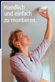
Foto- elektronischer Sensor